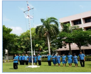
ภาพเสาธง (แบบที่ 2) (มองทางด้านหน้า)