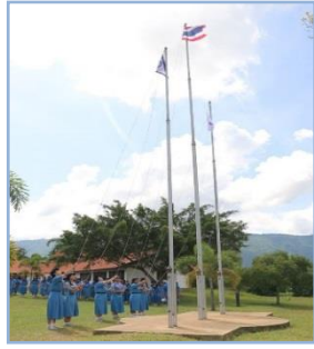
ภาพเสาธง (แบบที่ 1) (มองทางด้านหลัง)